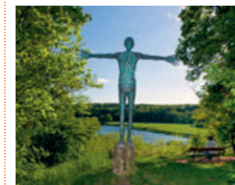
▼ Mildener Kreuzmensch im Jutta-Park

Dieser Landschaftspark wurde im 19. Jahrhundert im englischen Stil angelegt. Ein Aussichtsturm und ein Springbrunnen bereichern das Bild. Das Parkgelände dient Bildhauern und Klangkünstlern zur Präsentation ihrer Werke. Die Klanginstallation im Turm, das Flatter-Echo-Rondell oder die zahlreichen Skulpturen kitzeln die Sinne.