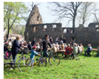
▲ Kloster Nimschen