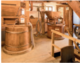
▲ Museum Wassermühle