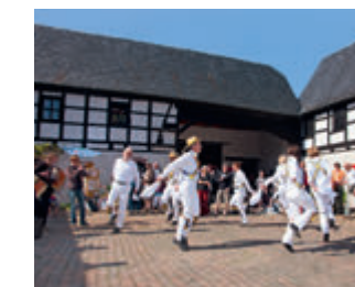
▼ Morriстанz im Hof der Denkmalschmiede

Der malerische Ort mit vielen Großartigkeiten besticht durch sein vielseitiges und kulturelles Angebot der Denkmalschmiede Höfgen. Ausstellungen, Konzertreihen und Musikfestivals – hier mischt sich der Charme des Landes mit dem internationalen Flair der Künstler. Seit Jahrzehnten gilt der Ort als Muse der Inspiration.