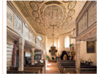
▲ Barockbemalung in der Kirche